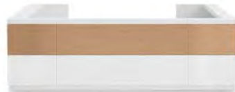
Vogue L350 P278 H109