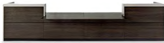
Vogue L487 P75 H109